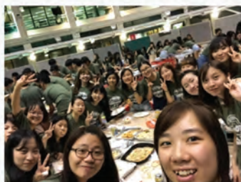
HAVE A GOOD TIME ORIENTATION NIGHT