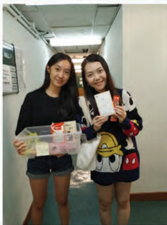
樓會成員送暖活動~